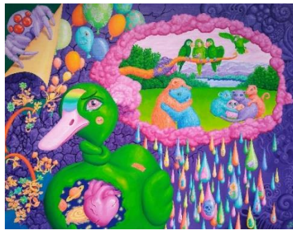
Ent(e)freundet (Öl) Mile Fiori, Köln