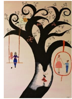
Lebensbaum der Freundschaft (Acryl) Michaela Horn, Merzig