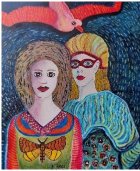
Die zwei Freundinnen (Acryl) Ingeborg Jung, Goch